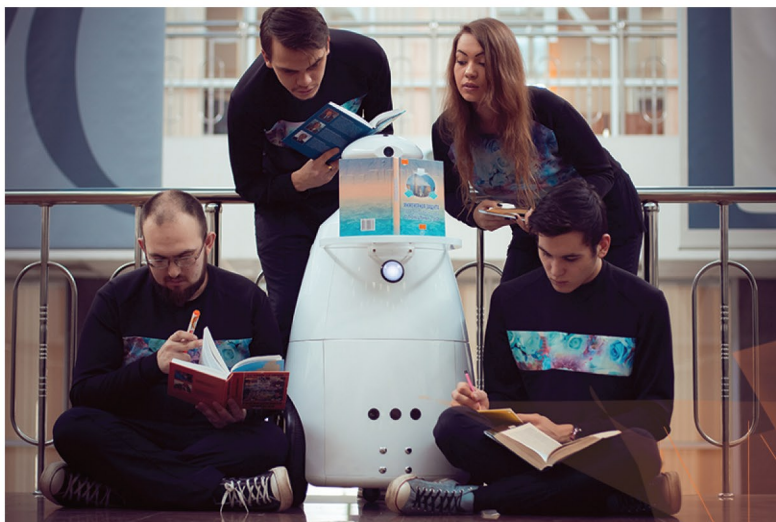
Шутки должны быть не только смешными, но и умными